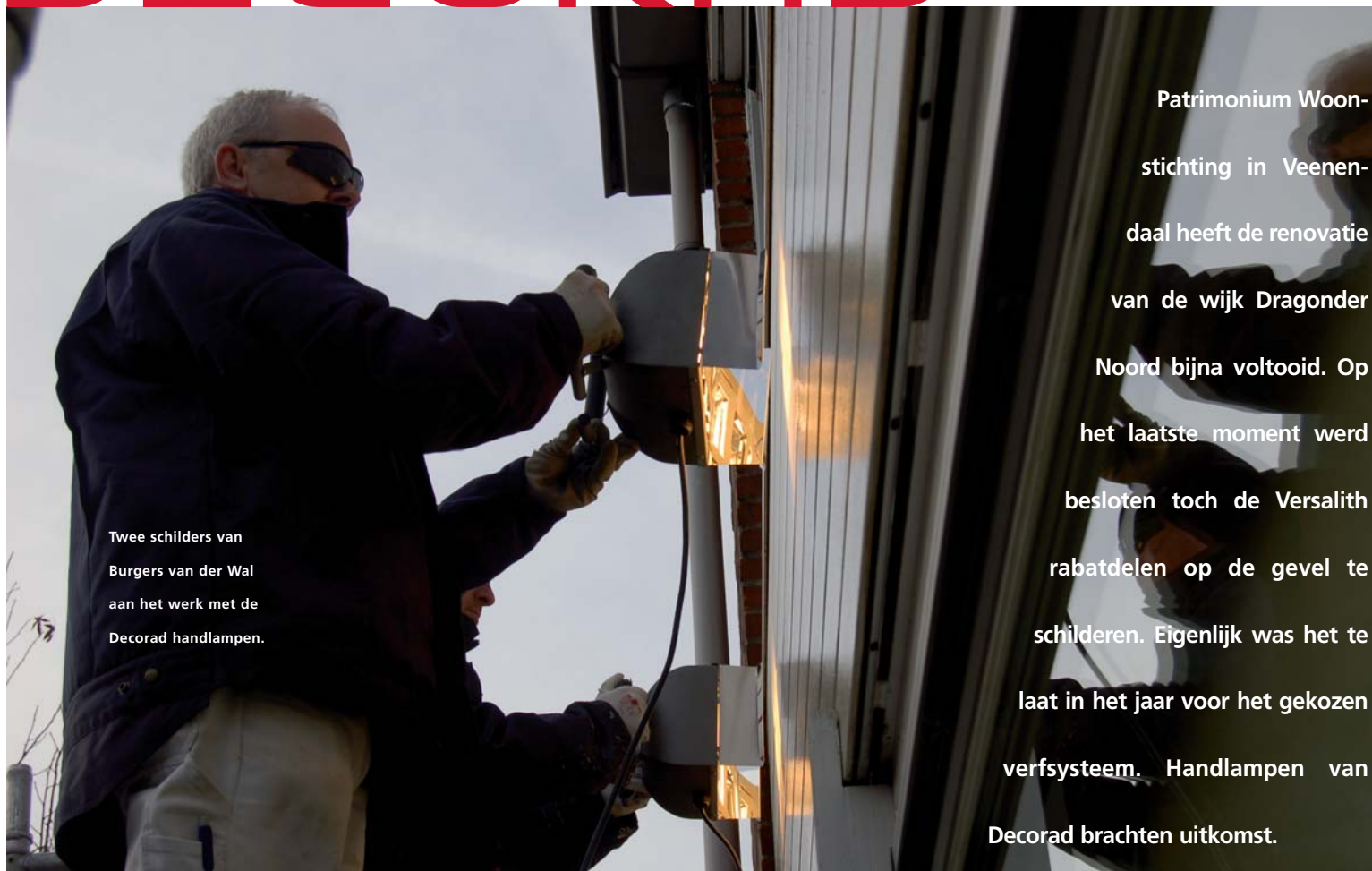
Twee schilders van Burgers van der Wal aan het werk met de Decorad handlampen.

Patrimonium Woonstichting in Veenendaal heeft de renovatie van de wijk Dragonder Noord bijna voltooid. Op het laatste moment werd besloten toch de Versalith rabatdelen op de gevel te schilderen. Eigenlijk was het te laat in het jaar voor het gekozen verfsysteem. Handlampen van Decorad brachten uitkomst.